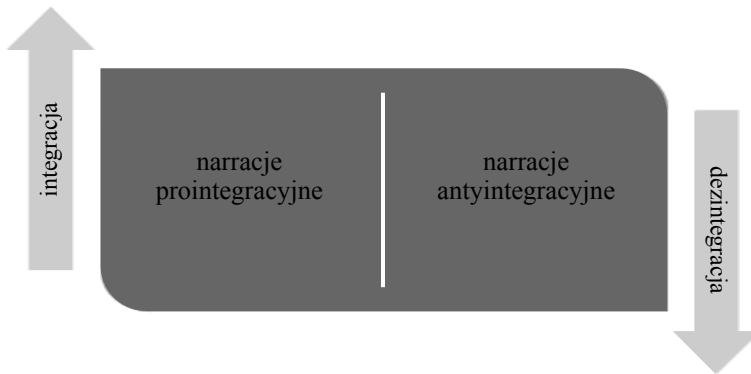
Schemat 1. Podstawowe narracje integracyjne

jako proces historyczny, obejmujący wybrane obszary gospodarki i polityki, ale wpływający również na rozwiązania w zakresie spraw społecznych, a nawet kultury, który rozpoczął się po II wojnie światowej w Europie Zachodniej i trwa do dzisiaj. Tak rozumiane narracje integracyjne można w uproszczony sposób podzielić na narracje prointegracyjne i antyintegracyjne, w skrajnych przypadkach prodeintegracyjne. W pierwszych mieszczą się różne pomysły na to, jak integrować Europę lub jakies jej części, drugie skupiają się przede wszystkim na zagrożeniach płynących z integracji, z czego wywodzą konieczność powstrzymania, ograniczenia, całkowitej rezygnacji lub odwrócenia procesów integracyjnych. W łatwy sposób można w tym podziale odnaleźć miejsce dla tzw. euroentuzjastów czy eurosceptyków, na których umownie dzieli się opinia publiczna w Polsce.